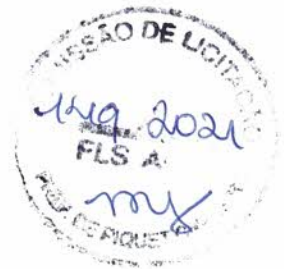
PEDRO DE ALCÂNTARA LEANDRO SECRETÁRIO DE AGRICULTURA FAMILIAR