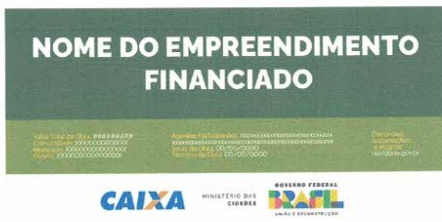
Figura 3 – Modelo de Placas de Obras do Governo Federal