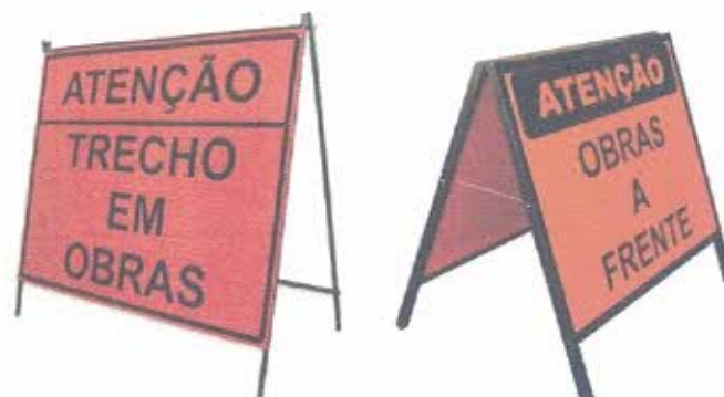
Figura 5 – Modelos de Placas de Obra