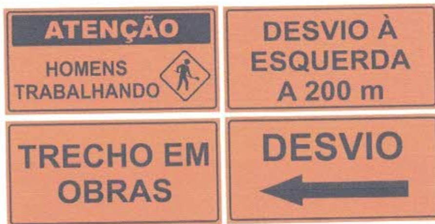
Figura 4 – Modelo de Placas de Obras do Governo Federal

Considerou-se para a respectiva obra a instalação de placas de sinalização de obras, conforme especificado no Manual Brasileiro de Sinalização de Trânsito – Volume II (Sinalização Vertical de Advertência) – Modelo A-24.