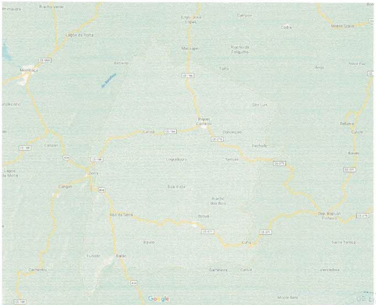
Figura 2 – Modelo geral do Município