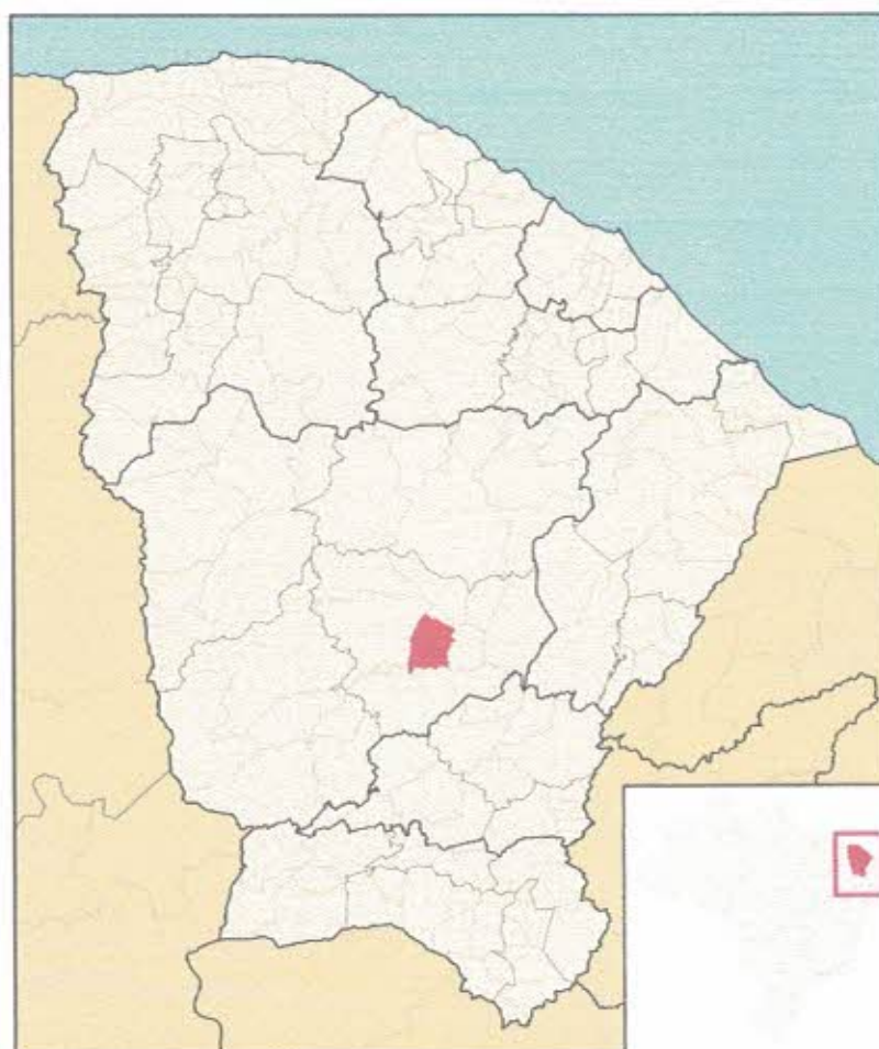
Figura 1 – Mapa de Situação do Município

O município de Piquet Carneiro está dividido em quatro regiões: Sede, Ibicuã, Catolé da Pista e Mulungu.